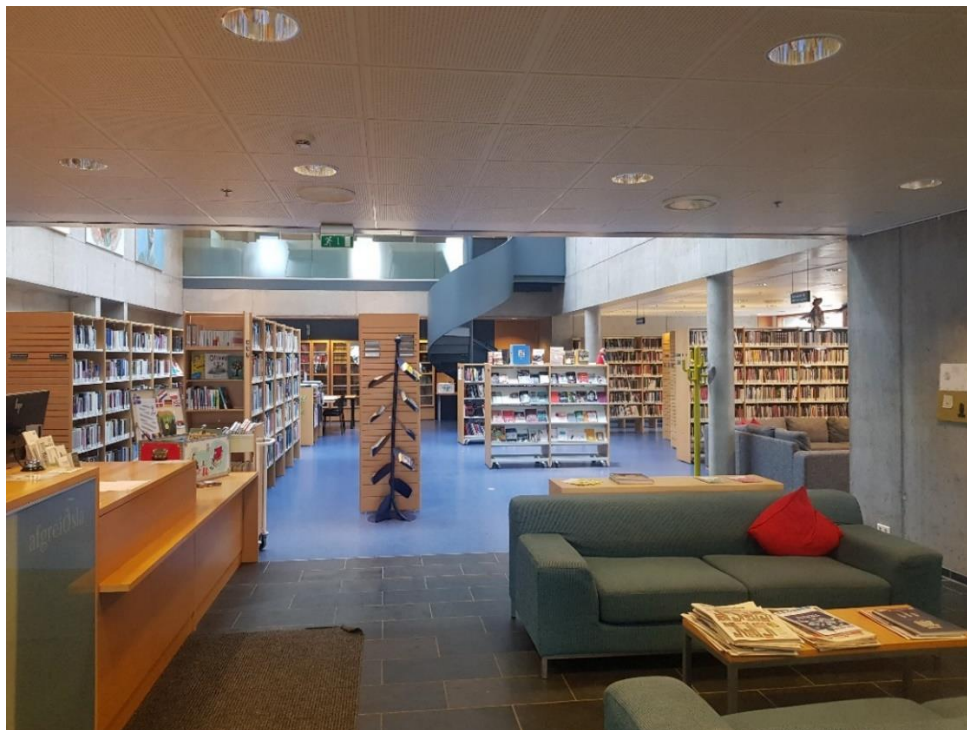
Mynd 5 Bókasafn Austur-Skaftafellssýslu

Bókasafn Austur-Skaftafellssýslu sem jafnframt er bókasafn Framhaldsskólans í Austur-Skaftafellssýslu er á neðstu hæð í Nýheimum. Bókasafnið er rúmgott og vel búið bókum og þar vinnur bókasafnsfræðingur sem veitir nemendum og kennurum skólans þjónustu. Þetta er skýrt dæmi um hagkvæmni þess að hafa skóla og þekkingar- og menningarsetur í sama húsnæði, Nýheimum. Bókasafnið sér einnig um bóksölu námsbóka því engin bókabúð er á Höfn. Nemendur í rýnihópi kvörtuðu yfir háu bókaverði og kalla eftir skiptibókamarkaði á námsbókum.