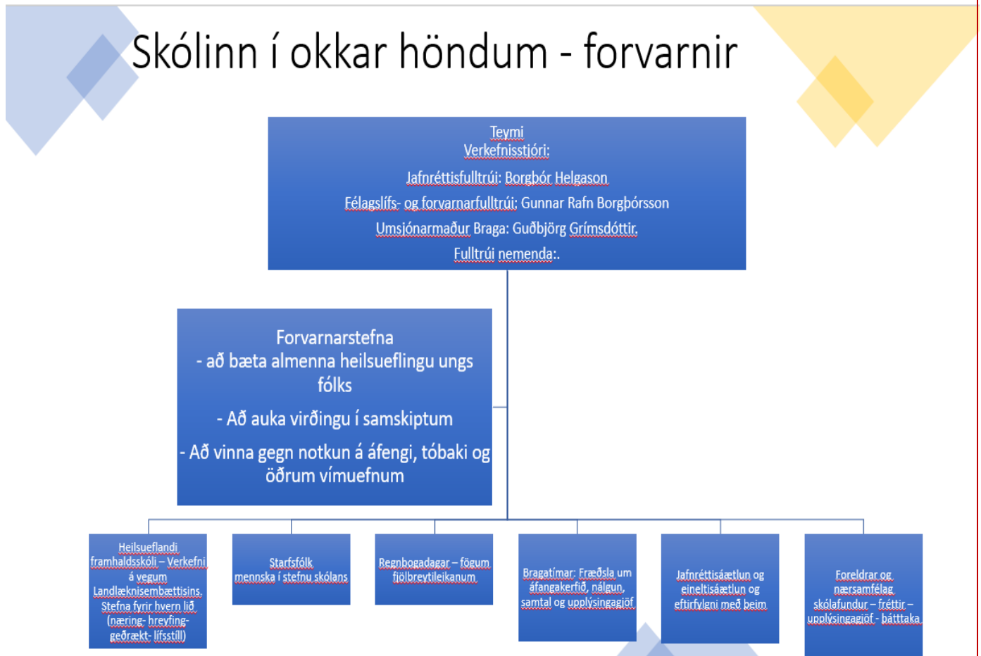
Mynd 1. Skólinn í okkar höndum

Markmið Skólans í okkar höndum er heildstæð forvörn líkamlegrar, andlegrar og félagslegrar heilsu – til eflingar lærdómssamfélagsi FSu. Til að ná markmiðinu er fléttað saman fræðsla og aðgerðum gegn einelti, leiðum að enn betri skólabrag, dagamun og heilsuefandi framhaldsskóla. Allir sem koma að starfi FSu eru þátttakendur í verkefninu: Nemendur, kennarar, starfsfólk, stjórnendur, foreldrar og yfirvöld. Skólinn í okkar höndum var stofnað upp úr Ölveus eineltisáætluninni. Á fyrstu tveim önnum sínum í skólanum taka allir nemendur áfanga í félagsfræði og umhverfisfræði. Þar er lögð áhersla á Heimsmarkmið Sameinuðu þjóðanna um sjálfbæra þróun og grunnþætti menntunar sem skilgreindir eru í aðalnámskrá framhaldsskóla og öllum skólum ber að leggja áherslu á. Í ársskýrslu skólans er gert grein fyrir þeim verkefnum sem unnin hafa verið undir hatti Skólinn í okkar höndum – forvarnir.