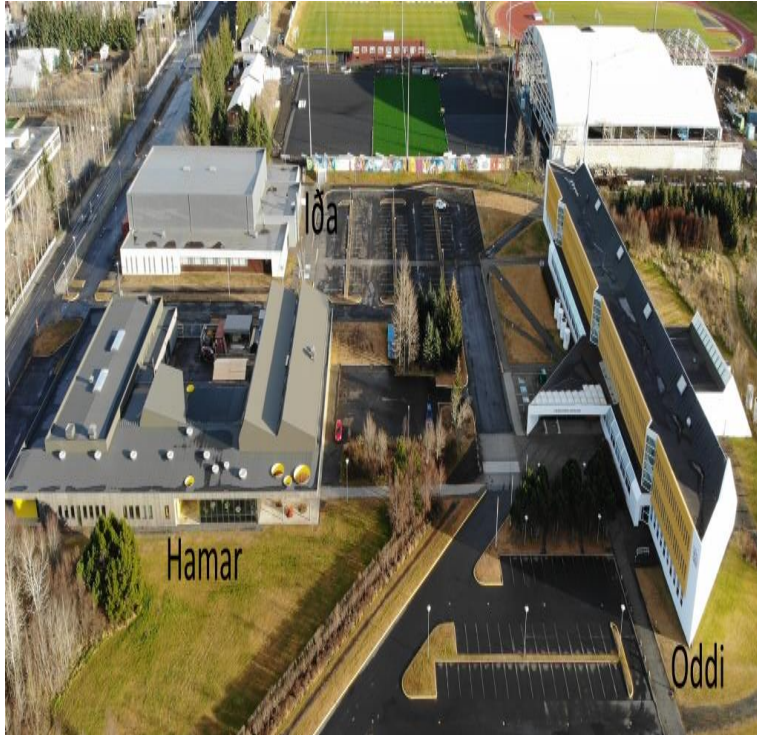
Mynd 3. Afstöðumynd Fjölbrautaskóla Suðurlands.

Allt skólahúsnæði skal uppfylla kröfur laga um aðbúnað, hollustu og öryggi á vinnustöðum. Einnig ber að uppfylla kröfur heilbrigðis- og byggingaryfirvalda til slíkra mannvirkja. Húsnæði, skólalóð og allur aðbúnaður þarf að vera þannig úr garði gerður að unnt sé að ná markmiðum laga um framhaldsskóla og aðalnámskrár framhaldsskóla. Er þar sérstaklega átt við að húsnæðið henti þeirri starfsemi sem þar fer fram og nemendum og starfsfólki skóla sé tryggt öruggt og heilsusamlegt vinnuumhverfi sem skapar öryggi og vellíðan.