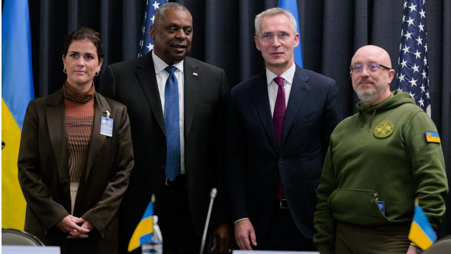
Mynd 5 Pórdís Kolbrún Reykfjörð Gylfadóttir utanríkisráðherra, Lloyd Austin, varnarmálaráðherra Bandaríkjanna, Jens Stoltenberg, þáverandi frkvstj. Atlantshafsbandalagsins, og Oleksii Reznikov, þáverandi varnarmálaráðherra Úkraínu, á fundi í Ramstein 20. janúar 2023.

Stuðningur við varnarbaráttu Úkraínu vegna innrásarstríðs Rússlands er forgangsmál fyrir öryggi Evrópu og hafa ríki Atlantshafsbandalagsins og önnur lýðræðisríki litið á stuðninginn sem hluta af viðbúnaði og aðgerðum í öryggis- og varnarmálum. Frá upphafsdögum stríðsins hefur Ísland lagt sig fram við að styðja varnarbaráttu Úkraínu með málsvarastarfi í alþjóðastofnunum, þátttöku í þvingunaraðgerðum, mannúðaraðstoð og varnartengdum stuðningi.