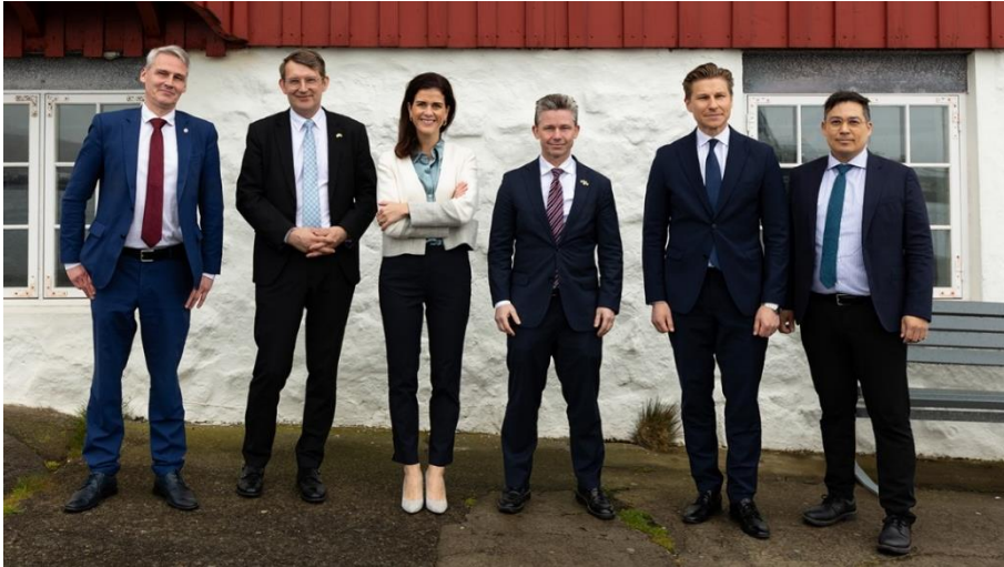
Mynd 3 Ný langtímafestna fyrir norrænt varnarsamstarf (NORDEFECO) til ársins 2030 var undirrituð á fundi norræna ráðherra og fulltrúa stjórnvalda í Færeyjum og Grænlandi sem fram fór í Þórshöfn í Færeyjum í apríl.