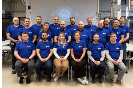
Mynd 10 Íslenski hópurinn á Locked Shields, netvarnaræfingu Atlantshafsbandalagsins, 2024.