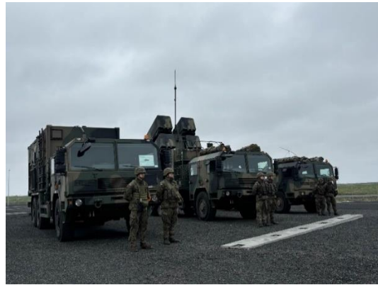
Mynd 9 Pólskt strandvarnarkerfi á varnaræfingunni Norður-Víkingi 2024.

Varnaræfingin Norður-Víkingur er haldin á grundvelli tvíhliða varnarsamnings Íslands og Bandaríkjanna og fer að jafnaði fram á tveggja ára fresti. Síðasta æfing fór fram um mánaðamótin ágúst-september í ár og sú næsta er fyrirhuguð 2026.