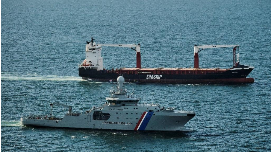
Mynd 8 Af vettvangi varnaræfingar Íslands og Bandaríkjanna, Norður-Víkings 2024.

Markvisst hefur verið unnið að því að bæta innlendan varnarviðbúnað í samstarfi við Bandaríkin, Atlantshafsbandalagið og helstu samstarfsríki. Þunginn í þeim viðbúnaði snýr að samstarfi við önnur ríki en þar gegna einnig önnur ráðuneyti og stofnanir mikilvægu hlutverki, sérstaklega dómsmálaráðuneytið, Landhelgisgæslan, ríkislögreglustjóri og íslenska netöryggissveitin (CERT-IS).