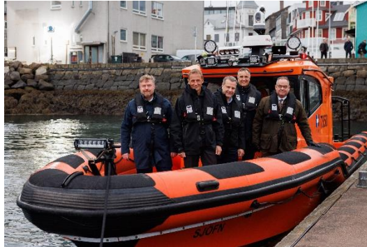
Mynd 4 Yfirmenn hermála norrænu ríkjanna funduðu á Íslandi í október og kynntu sér m.a. starfsemi Rafnar-báta.

Ný langtímastefna fyrir norrænt varnarsamstarf (NORDEFCO) til ársins 2030 var undirrituð á norrænum ráðherrafundi í Þórshöfn í Færeyjum í apríl. Síðar tilkynntu yfirmenn hermála landanna um stefnuramma fyrir norrænt varnarsamstarf. Markmið hans er að bæta getu Norðurlanda til að mæta sameiginlegum áskorunum í öryggismálum, hvort sem er á tímum friðar, spennu eða átaka.