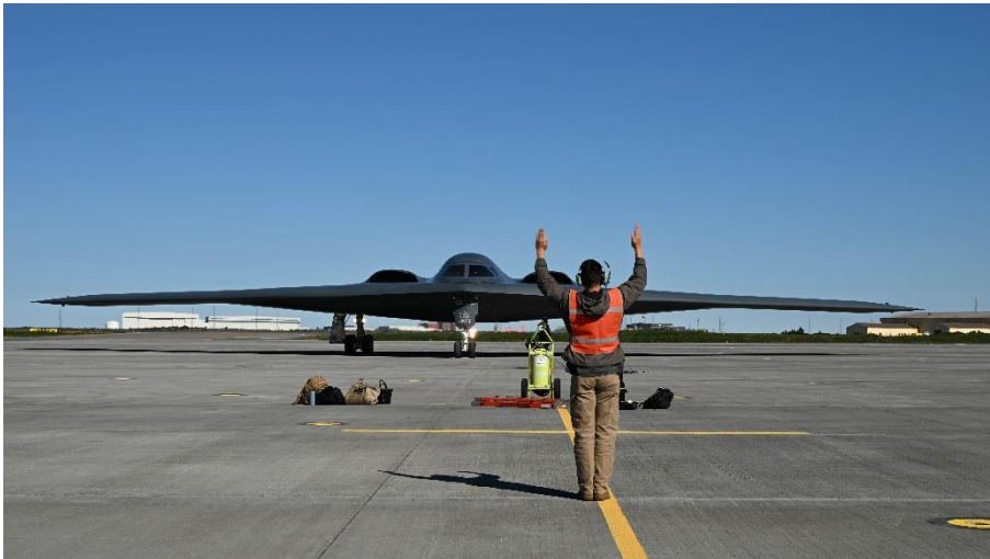
Mynd 2 Sérstök flugsveit bandaríska flughersins starfaði tímabundið frá öryggissvæðinu á Keflavíkurlugvelli um miðjan ágúst 2023 með þrjár langdrægar B-2 sprengjuflugvélar.