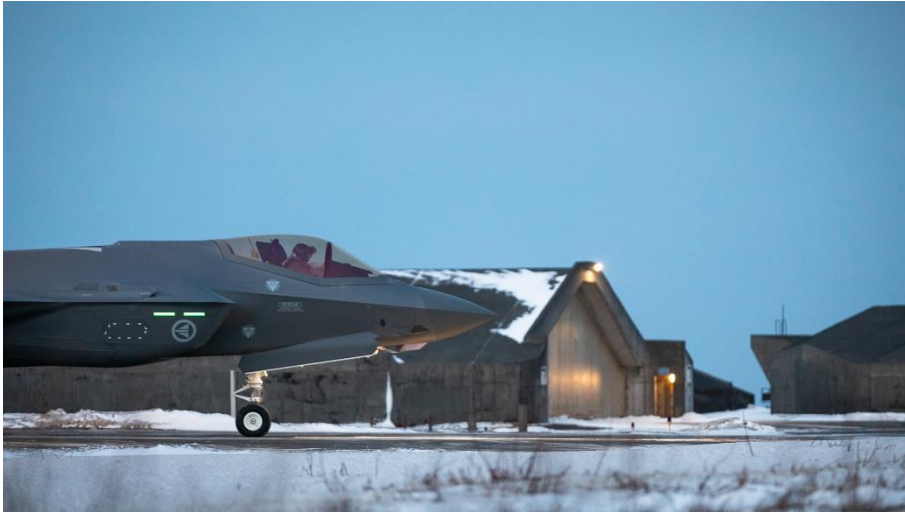
Mynd 1 Norðmenn sinntu loftrýmisgæslu Atlantshafsbandalagsins við Ísland í janúar og febrúar 2023.