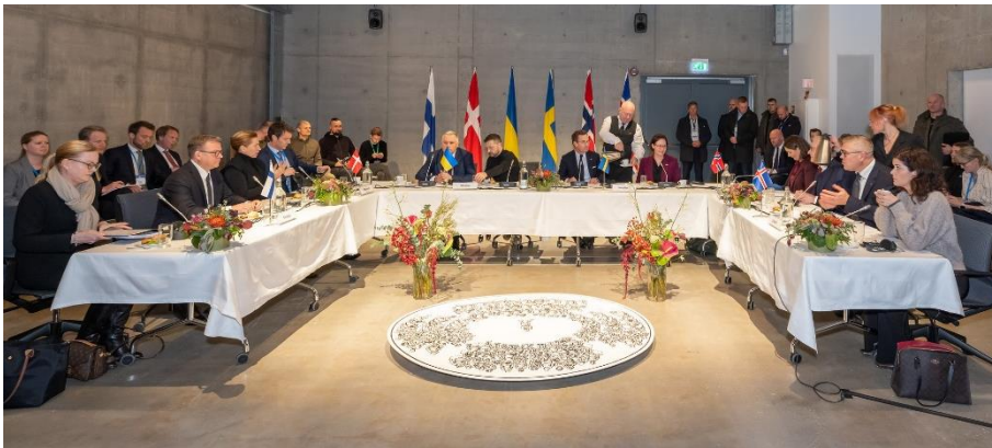
Mynd 6 Fjórði leiðtogafundur Norðurlandanna og Úkraínu fór fram á Þingvöllum í október.