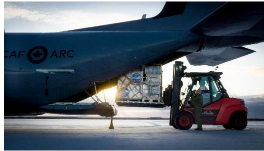
Mynd 7 Níu tonn af vetrarútbúnaði frá Íslandi fyrir varnarsveitir Úkraínu og almenning hlaðið um borð í kanadíska herflutningavél.