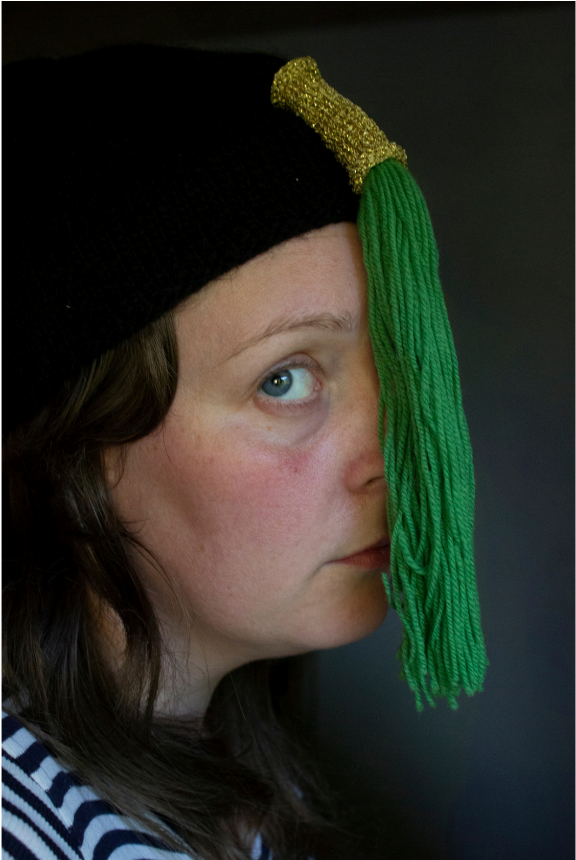
Sjálfsmyndir í búning (2024) Stelpuskott (2024)