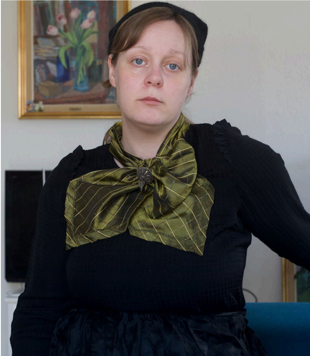
Sjálfmyndir í búning (2024) Ólétt (2023)