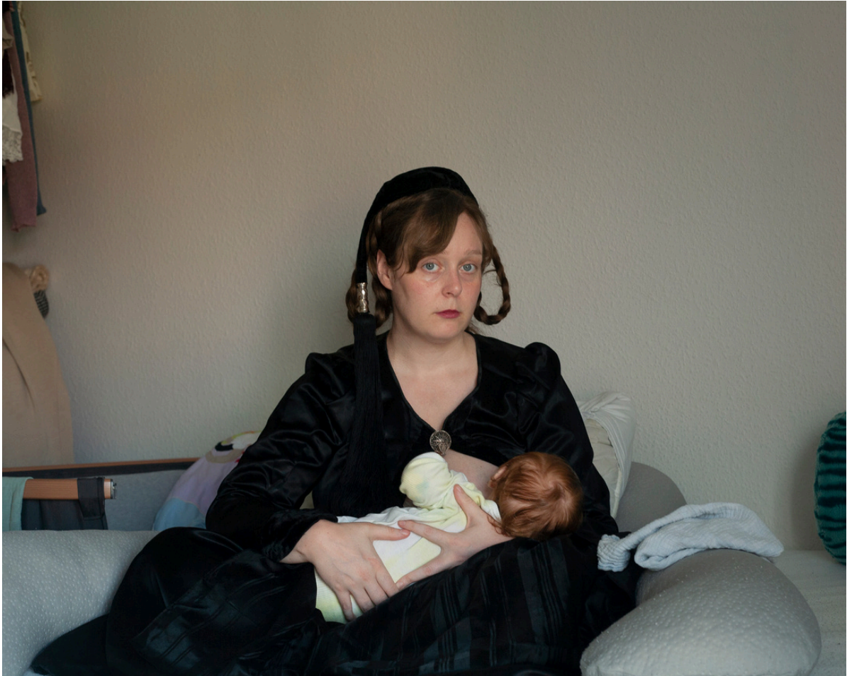
Sjálfsmyndir í búning (2024) Móðir (2023)

IS „Þarna var ég nýbúin að eiga strákinn minn og vildi taka sjálfsmynd á meðan ég var að gefa brjóst. Ég var svo heppin að fá peysufötin að gjöf frá Þjóðdansasfélagi Reykjavíkur á meðan ég var ólétt og passaði ég vel í þau. Ég gat því tekið myndir af mér þó að líkaminn væri að fara í gegnum miklar breytingar. Það var einmitt það sem mér fannst svo áhugavert að skoða.“