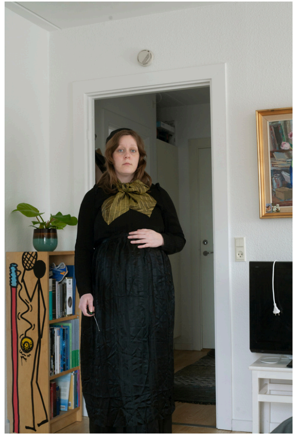
Sjálfsmyndir í búning (2024) Bumba (2023)

IS „Hérna er ég komin á steypirinn – meira að segja fram yfir settan dag. Mér fannst skrítið að sjá mig óléttu í búning, minnst þess ekki að hafa séð það áður, óléttu konu í þjóðbúning.“