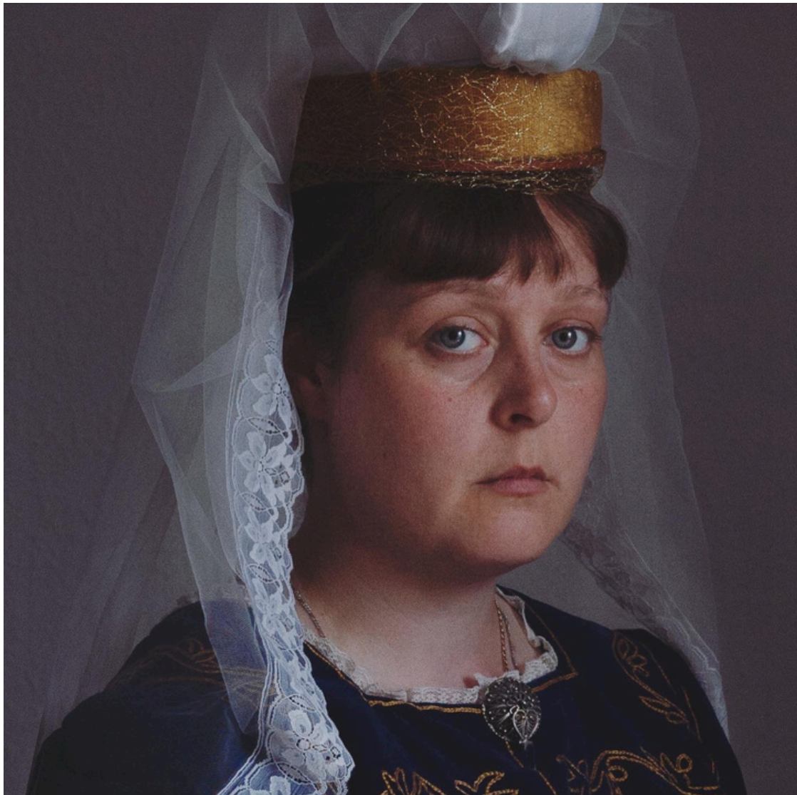
Bútur úr verkinu Isländerinde i dragt (2022)

IS „Þarna var ég búin að krýna sjálfa mig sem fjallkonu fyrir lokasýningu í listaháskólanum mínum, þann 17. júní 2022. Ég fór til Íslands að sækja búninginn sem ég fékk lánaðan frá Þjóðdansafélagi Reykjavíkur og bjó til höfuðskart úr gömlum blómapotti og efni sem ég fann í Rauða Krossinum í Skeifunni. Ég tók myndina heima í Kaupmannahöfn, sitjandi á rúminu mínu, og varð hún byrjunin á öllu þessu ferli.“