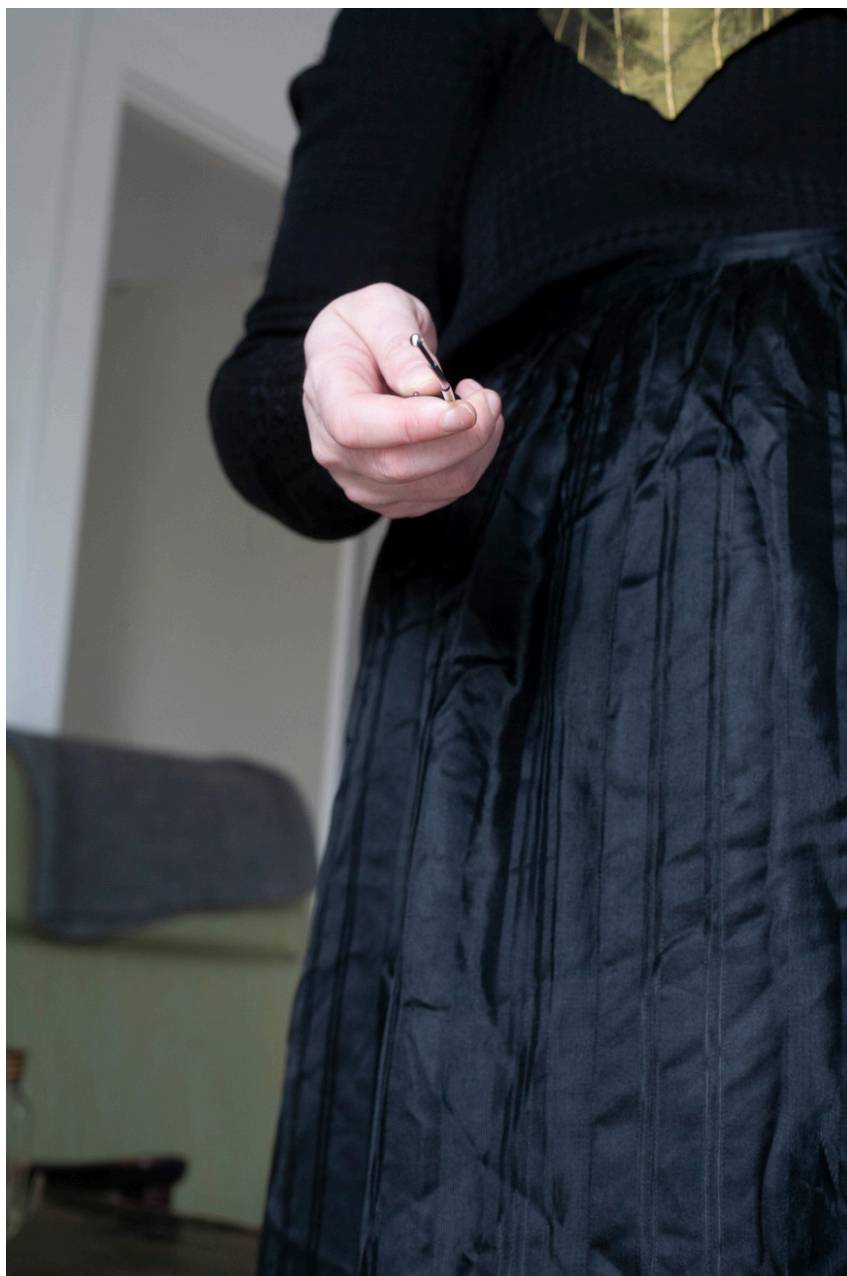
Sjálfsmyndir í búning (2024) Nálæg (2023)