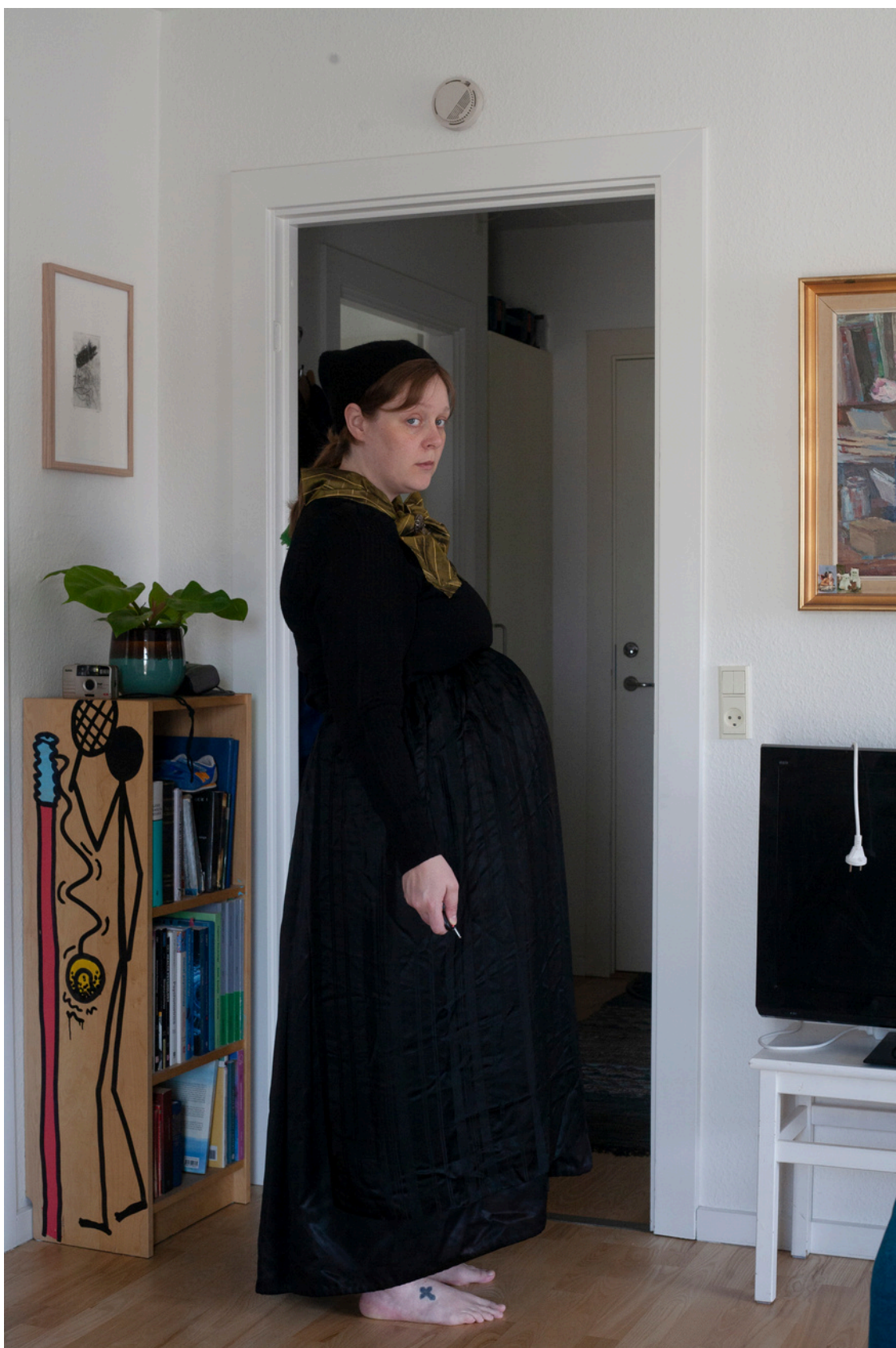
Sjálfsmyndir í búning (2024) Á blið (2023)