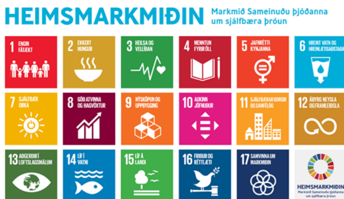
Mynd 3 - Heimsmarkmið SP